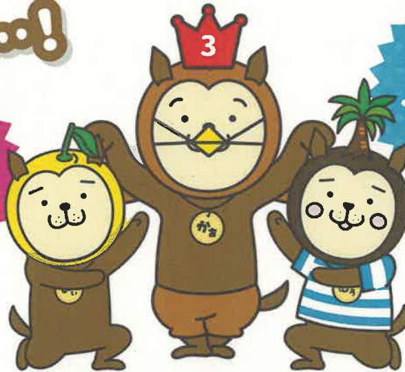
宮崎県民の1日1人あたりの平均歩数